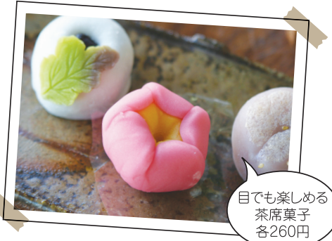
目でも楽しめる茶席菓子各260円

クリスマス時期にはかわいいケーキが登場します。サンタの顔をかたどったケーキと、チョコレートケーキがセットになったツインケーキは予約限定商品！