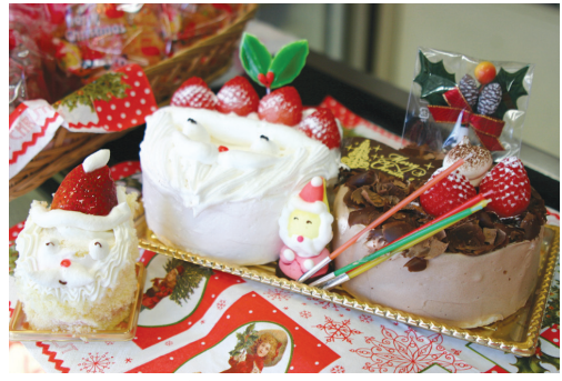
サンタさん410円(手前)と、クリスマス予約限定のツインケーキ3675円(奥)