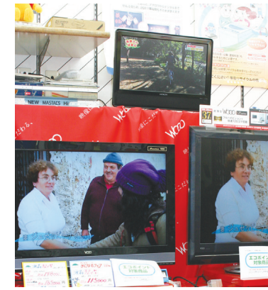
修理もおまかせ、町の電気屋さん