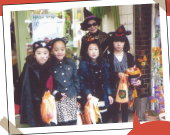
平成18年から始めたハロウィンは、今や350人の子どもが集まる、名物イベントです