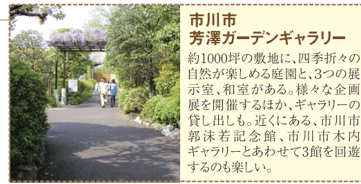
市川市 芳澤ガーデンギャラリー 約1000坪の敷地に、四季折々の自然が楽しめる庭園と、3つの展示室、和室がある。様々な企画展を開催するほか、ギャラリーの貸し出しも。近くにある、市川市郭沫若記念館、市川市木内ギャラリーとあわせて3館を回遊するのも楽しい。