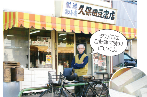
夕方には自転車で売りにいくよ!