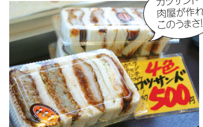
カツサンド肉屋が作ればこのうまさ!

一番人気は種類豊富なカツサンド(500円)。そのほか、おいしい黒毛牝牛やお惣菜もあります。2000円以上で配達もしてくれますよ(3km以内)。