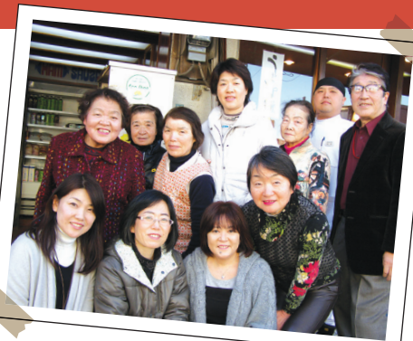
「団結力には自信あり!」商店会のみなさん

「ここは昭和が残っているのではなく、昭和で止めているの」と、商店会会長。おしゃべりしていく人のための椅子がある、洋品店。夕方になると揚げたてのコロッケを買う人の列ができる肉屋さん。住んでいる人はみな顔見知り。お年寄りの買い物も引き受け、豆腐一丁でも届けちゃう。そんな、人の温もりにあふれた商店会です。市内の中学生による好きな商店街アンケートで、第一位となったのもうなづけます。