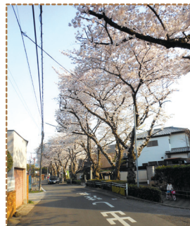
いちかわ文学の道 市川ゆかりの文学者と作品の紹介板が15枚設置された「文学の道」。約400m続くメイヨシノの桜並木(約50本)は桜のトンネルをくぐるよう。