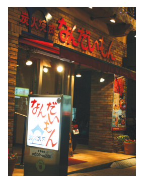
駐車場は店前の東京ベイ信用金庫裏にあり

⑦居酒屋 鳥由 創業36年、大人がくつろげる居酒屋。焼き鳥はもちろん魚も旨いです。毎朝自らの厳しい目で選ぶ鮮魚は自信あり。父子が仲良く立つ板場は活気にあふれ、ついのお酒がすすみそうですね。