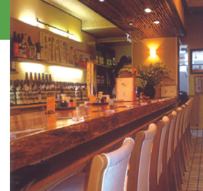
小さな扉を開けると、洗練された空間が広がります

⑦居酒屋 鳥由 創業36年、大人がくつろげる居酒屋。焼き鳥はもちろん魚も旨いです。毎朝自らの厳しい目で選ぶ鮮魚は自信あり。父子が仲良く立つ板場は活気にあふれ、ついのお酒がすすみそうですね。