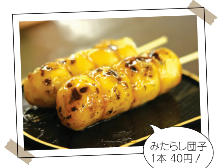
みたらし団子 1本 40円!

⑥モツ焼き&釜飯 栃木屋・久蔵 新鮮なモツは1本1本手差し。呑んだ後の締めには、五目釜飯がオススメです。