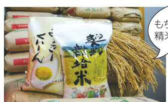
もちろんお店で精米してま〜す

⑨炭火焼肉 なんだいもん 肉質にこだわり、一人前の盛りも多い焼肉屋さんです。和牛カルビだけで7種類も! そして、厚切りのタン塩も絶品! オムニ手作りのキムチやチヂミもオススメです。モリモリ食べて、グイグイ呑んでもお財布に優しいのがうれしいです。