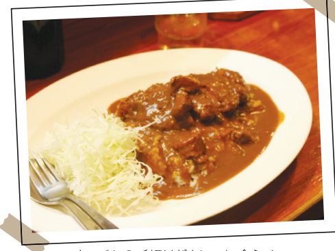
キャベツの千切りがカレーに合う!

揚げ物を中心とした定食が人気。ご飯・みそ汁・キャベツが食べ放題なのもうれい! メニュー豊富だから毎日行っても飽きません!