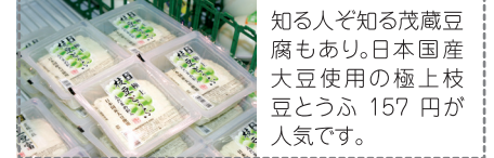
知る人ぞ知る茂蔵豆腐もあり。日本国産大豆使用の極上枝豆とうふ。157円が人気です。

旬の新鮮野菜を毎日特価で販売。さらにお得なタイムサービスもありますよ。お見逃しなく!