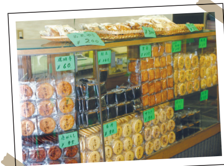
一番人気は「おこげ330円」