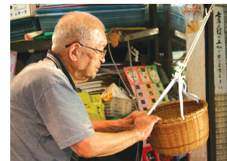
そして…おつりはカゴから出てくる!

「おじさん、どれがおいしい?」「今は水ナスだな、浅漬けにするとウマイよ!」スーパーにはない、会話が楽しめる八百屋さんです。