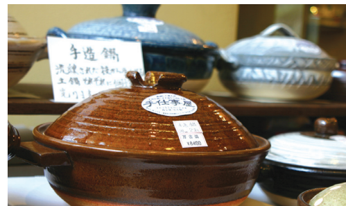
味わいのある鍋各種