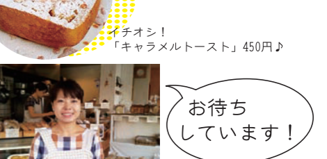
イチオシ！ 「キャラメルトースト」450円♪

天然酵母 & 国産小麦のパンの店。スープ・デザイ (おかず) ・デザートも手作りです。