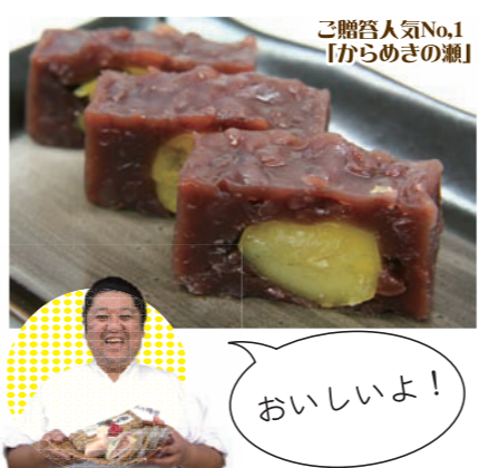
ご贈答人気No.1 「からめきの瀬」

大門通り沿いにある「大門岡塾」の店主は、テレビチャンピオンの全国和菓子職人選手権で準優勝した実力の持ち主。「からめきの瀬」や「下総最中」など、こだわりの銘菓が人気です。