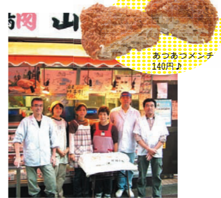
あつあつメンチ 140円♪

『またあのコロッケが食べたい』と立ち寄る人が多いのが、創業60年「肉の山崎」。手作りコロッケ、カツサンド、チキンロールなどの惣菜が30種類以上並びます。