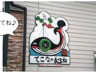
真間商店連合会のシンボル「てこなの心ね」