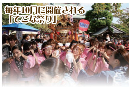
毎年10月に開催される「てこ祭り」

毎月第2金曜日に開催される、てこなフリースペースでの「源氏物語講座」は回を重ねるごとに参加者が増え、人気の講座となっています。