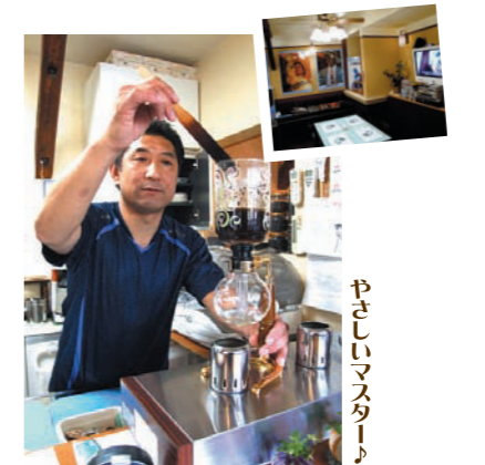
やさしいマスター♪

懐かしさ漂う喫茶店の店内の壁はギャラリーになっていて、行くたびに違う雰囲気を楽しめます。おすすめは北海道「ロイズ」の生チョコ付き「つぎはしブレンド」400円。