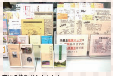
市川の情報がたくさん！