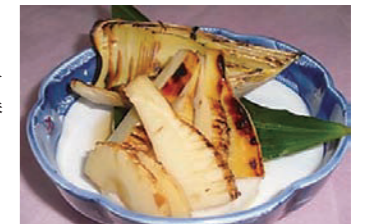
新たけのこのつけ焼き630円

絶品いわし料理や、体にやさしいヘルシー料理が自慢の店。11:50～14:00まで、日替わりのランチ定食もあります。3～4月は、旬のたけのこ料理がおすすめ！！