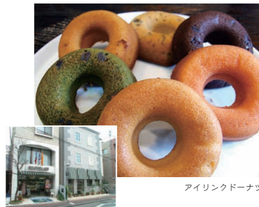
アイリンクドーナツ

日本でもトップクラスの創作洋菓子店。約30種類あるプチガトーのほか、ロールケーキ、焼き菓子、チョコレートなど、バラエティに富んだ商品が並びます。