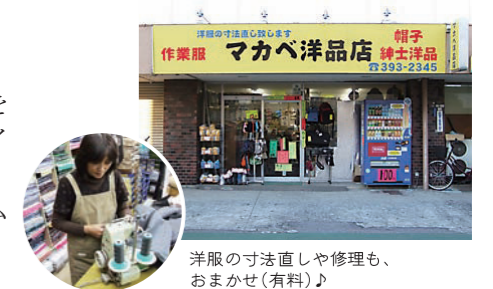
洋服の寸法直しや修理も、おまかせ(有料)♪

創業31年。作業着・作業用品・紳士用品・帽子など紳士用品を幅広く取り扱い、ズボンのサイズも73～105センチまで豊富。3,000円以上の商品は、ネーム代金が無料（一行）です。