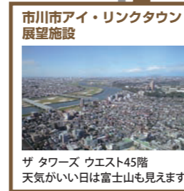
市川市アイ・リンクタウン展望施設 ザ・タワーズ ウェスト45階 天気の良い日は富士山も見えます。