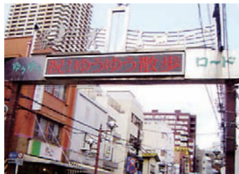
ゆうゆうビジョン

平成2年、商店会のイメージアップを図るため、三色のレンガタイルを敷き詰めた歩道や花壇、昔のガス灯をイメージした街路灯を整備しました。その時に、商店会の新しい名称を公募し「ゆうゆうロード」と命名しました。商店会のほぼ真ん中には「ゆうゆうビジョン」と名づけられた電光掲示板が建っています。公共情報や地域のお知らせなどを発信しているアーチは平成3年に設置されて以来、すっかり商店会のシンボルとなり、道行く人の目をひいています。また商店会は、学童通学の安全や地域老人の世話役、店舗の夜間照明維持、そして災害時の避難誘導等大きな役割なども地域に対して引き受けています。「住みよい街」「人にやさしい道路づくり」をめざして現在も道路を整備しており、4月には新しい歩道が一部お目見えしました。