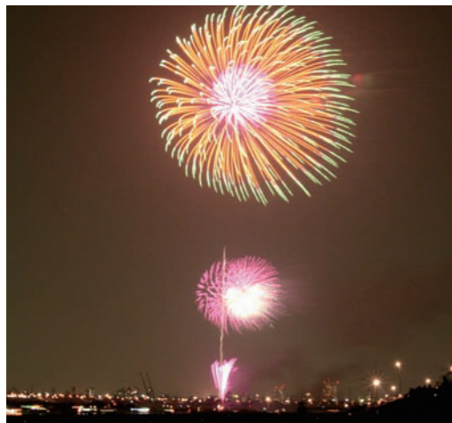
市川市民納涼花火大会