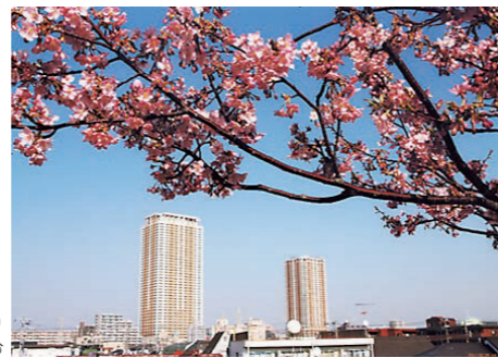
江戸川河川敷より アイ・リンクタウンを望む

11月第一土曜日には、大洲防災公園で“みんなでつくろう ふるさと市川”を合言葉に、「市川市民まつり」が開催されます。市民団体のPRや実演・体験・露店の並ぶ、おまつり広場や、市内商店によるこだわりの品が所狭しと並び、わくわく広場を中心に市民サークルによる楽しいステージも行われています。