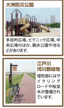
大洲防災公園 多目的広場、ピクニック広場、中央広場のほか、親水公園や池などがあります。