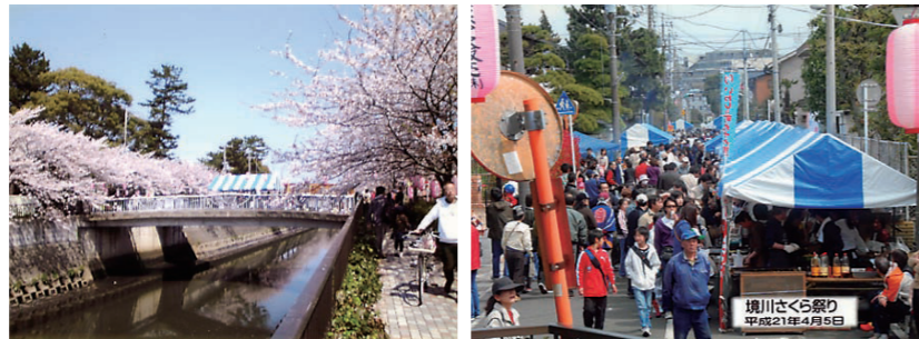
賑わいのある境川沿いの「さくら祭り」

昭和32年設立の鬼越駅前通り商店会近くの境川沿いは桜の花が咲き乱れ、市内有数の桜の名所となっています。商店会では、桜の時期に境川沿いでの「さくら祭り」を開催しています。