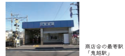
商店会の最寄り駅「鬼越駅」

国道14号沿いの木下交差点から境川までの広範囲に商店が軒を並べています。毎年、桜の季節には商店会の60本の街路灯に華やかな桜の飾り付けを施し、地域の方々に喜ばれています。