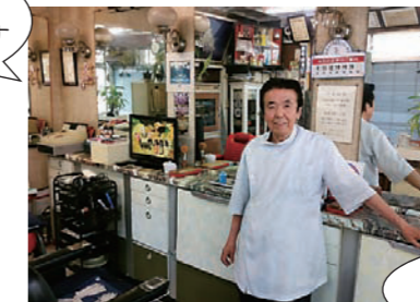
レトロな店内は趣があります

明治47・48年の創業。「当時はちょんまげもやっていたんです」と、現在4代目の店主。理髪腕もさながら昔の鬼越銀座を語ってくれます。