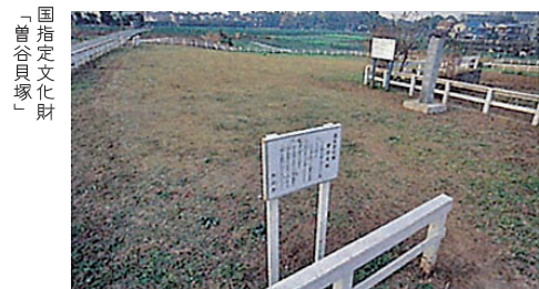
「国指定文化財」 「曾谷貝塚」

市川市の北東部に位置するJR武蔵野線「市川大野駅」は、昭和53年に開業しました。駅周辺は緑が多く、全国でも有数の梨の名産地であることから、広大な梨畑が広がっています。南大野地区は、区画整理事業で街並みが整備され、道路が広く商業施設および教育施設、行政出張所もあり生活利便性の高い地域となっています。曾谷貝塚地区内には、曾谷緑地、山王緑地をはじめとする樹林地が見られ、自然豊かな潤いのある街となっています。春日神社や曾谷貝塚といった歴史資源も多く見られます。国指定文化財「曾谷貝塚」は、東西210m、南北240mという大きな規模をもち、単独の馬蹄形貝塚としては日本でも最大級の広さがある貝塚です。緩やかに傾斜する台地上にあたり、現在は住宅と畑、そして広場が広がっています。曾谷貝塚地区の西側は、かつては国分川沿いに広がる水田地帯でしたが、昭和40年前半に土地区画整理事業により市街化され、曾谷小学校や山王公園といった公共施設や商店会があります。