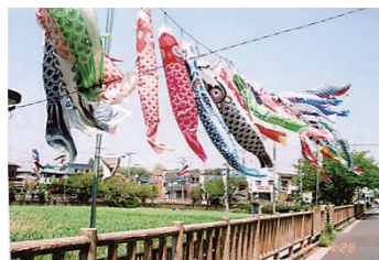
色とりどりの鯉が空に たなびく「鯉のぼり祭り」